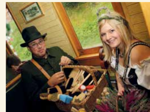
Das alljährliche Bürstenfest rund um die Museumsbahn Schönheide bietet die Möglichkeit Eisenbahnostalgie und regionale Handwerkstraditionen zu erleben. In diesem Jahr findet das Bürstenfest in Verbindung mit dem 13. Brückenfest am 15. und 16. September statt.

Nachdem inmitten des landschaftlich überaus reizvollen Westerzgebirges nunmehr an drei Orten Abschnitte der Bahn reaktiviert wurden, lag der Gedanke nah, die Bahnen nicht nur zueinander zu führen, sondern für eine umfassende touristische Vernetzung der Region zu nutzen. Die Kommunen der Region und zahlreiche Partner aus Wirtschaft und Tourismus entwickelten die Idee des ambitionierten Tourismusprojektes Schönheide/Carlsfeld und Umgebung. Kern des Projektes sind vier Bahnnetappen mit denen künftig die