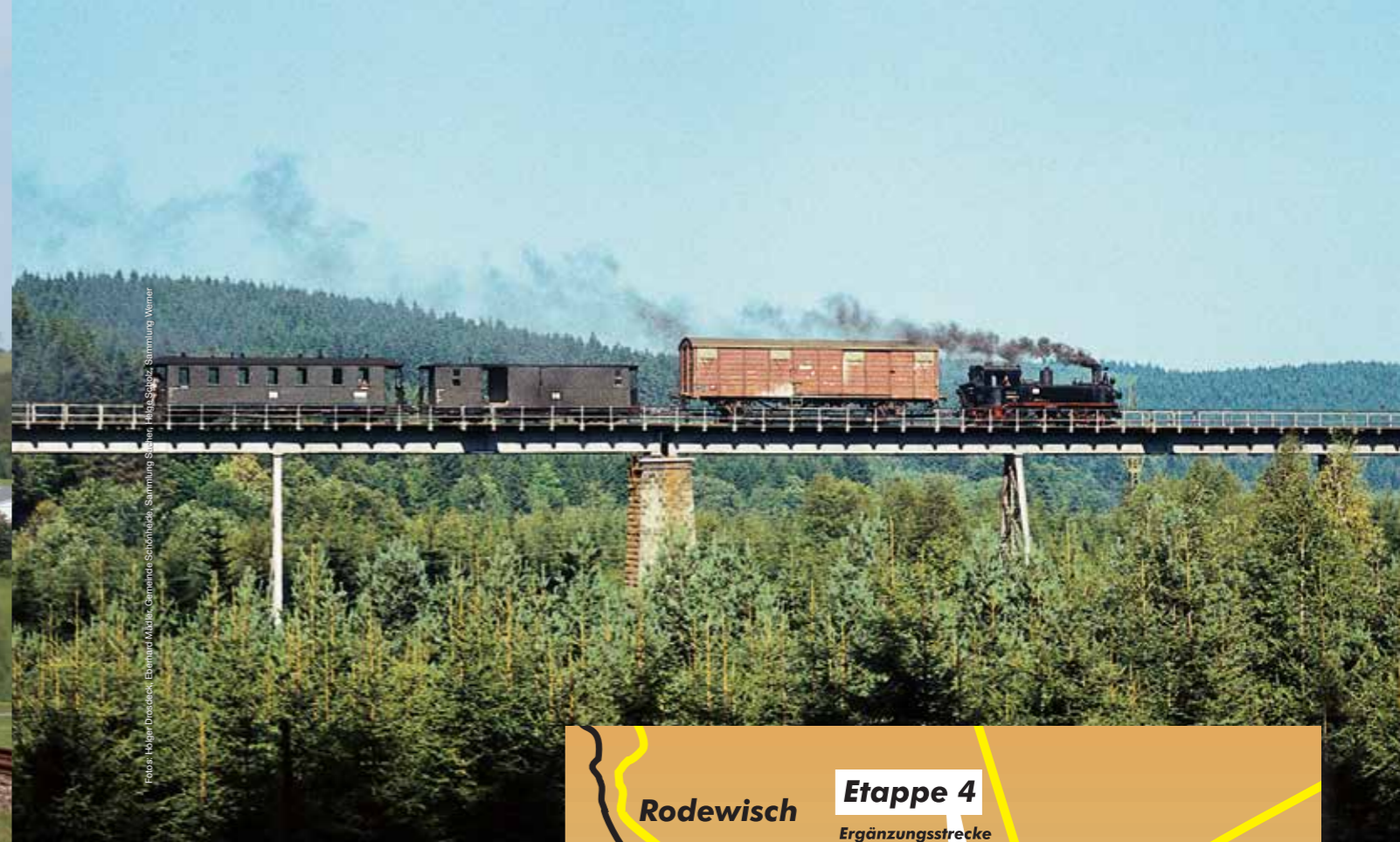
Die große Brücke über die Mulde bei Wilschhaus um 1970

raumforschung. Von Wilschhaus ausgehend gilt es in zwei Richtungen Etappen der Schmalspurbahn zu reaktivieren. So gilt es den Anschluss an die beliebte Schönheide Museumsbahn wiederherzustellen, dazu muss jedoch die Zwickauer Mulde gleich hinter dem Bahnhof Wilschhaus mit einer markanten Brücke überquert werden. Ein Schritt, der von der sachsenweit tätigen Stiftung Sächsischer Schmalspurbahnen mit einer breit angelegten Spendenaktion unterstützt wird. Der Streckenast von Wilschhaus nach Carlsfeld wird nach der geplanten Inbetriebnahme die Verbindung des Bahnnetzes zum Kammwanderweg Erzgebirge-Vogtland und der im Winter weithin beliebten Kammloipe herstellen. Auch die historische Carlsfelder Rundkirche befindet im Umfeld des Carlsfelder Bahnhofes.