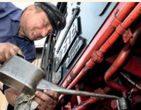
Mit Enthusiasmus und Begeisterung wird die Museumsbahn Schönheide durch einen ehrenamtlich tätigen Verein betrieben. Derzeit verkehren die Züge zwischen Schönheide und Stützengrün. Im Rahmen des Tourismusprojekts steht eine Erweiterung des Netzes bis Carlsfeld und Wernesgrün in Aussicht.

Gleich mehrere Bürstenfabriken hatten einen Gleisanschluss an die Schmalspurbahn. Auch heute sind noch mehrere Bürstenhersteller in der Region ansässig und die Tradition der Bürstenherstellung kann im Bürsten- und Heimatmuseum in Schönheide erlebt werden. Entlang der heutigen Museumsbahn Schönheide findet alljährlich im September das Bürstenfest statt. Am Endpunkt der 1893 eröffneten Strecke unweit des Bahnhofes Wilzschhaus mündet von Carlsfeld kommend die Wilzsch in die Zwickauer Mulde. Eine Streckenführung durch das Wilzschtal bot die einzige Chance, die holzverarbeitenden Betriebe im Tal und den am Erzgebirgskamm gelegenen Ort mit seiner Glashüttenindustrie, unter anderem der einst bekannten Weitersglashütte, an das Eisenbahnnetz anzubinden. So traten auch die