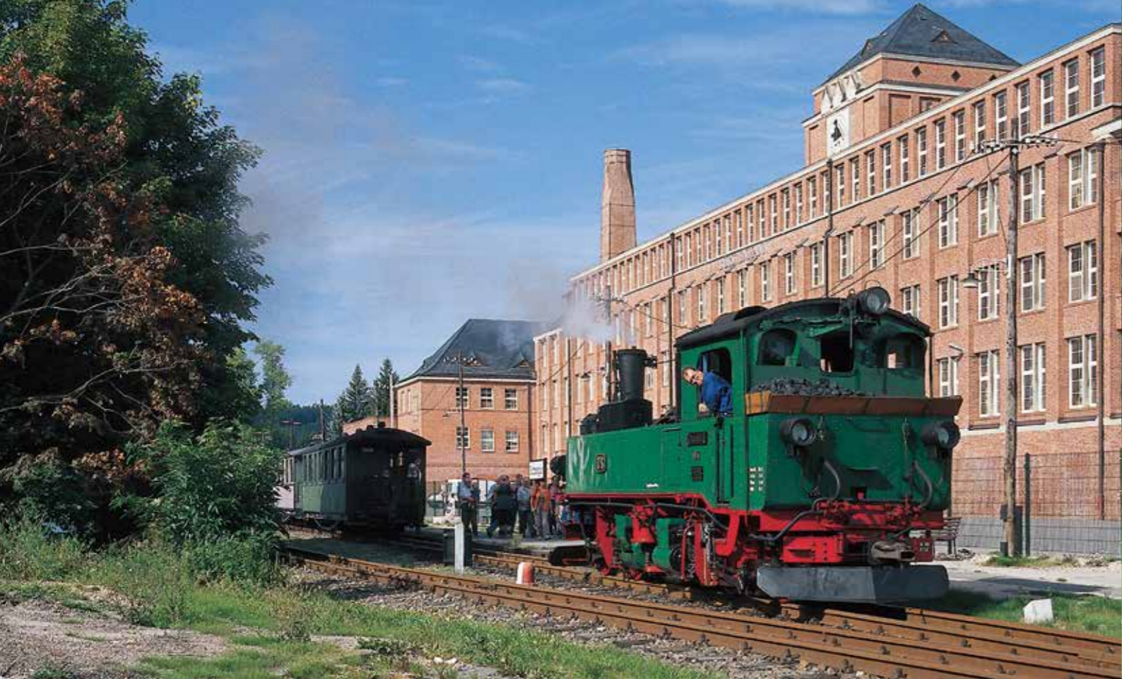
Direkt vor der Stützengrüner Bürstenfabrik halten die Züge der Museumsbahn Schönheide, einst wurden die Erzeugnisse hier direkt mit der Schmalspurbahn weiterbefördert.