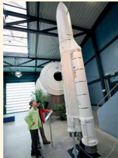
An der regelspurigen Strecke von Muldenberg nach Schönheide Ost befindet sich unmittelbar am Bahnhof Rautenkrantz die imposante Deutsche Raumfahrt Ausstellung

Höhepunkte der Region erschlossen werden können. So soll der Besucher künftig „Via Wilschhaus“ sowohl von Wernesgrün nach Eibenstock als auch von Schönheide nach Muldenberg fahren können. Als erste Etappe gilt es die Strecke von Muldenberg, bekannt durch die reizvoll gelegene Trinkwassertalsperre und die aktiv gepflegte Flößereitradition, über Morgenröthe-Rautenkrantz und Wilschhaus bis nach Schönheide Ost in Betrieb zu nehmen. Touristischer Höhepunkt ist zweifelsohne ein Besuch der bekannten Deutschen Raumfahrt Ausstellung in Morgenröthe-Rautenkrantz, welche direkt am Rautenkrantz Bahnhof zu finden ist. Die in den vergangenen Jahren neu gestaltete Ausstellung am Geburtsort von Sigmund Jähn, dem ersten Deutschen im Weltall veranschaulicht eindrucksvoll die Entwicklung der Welt-