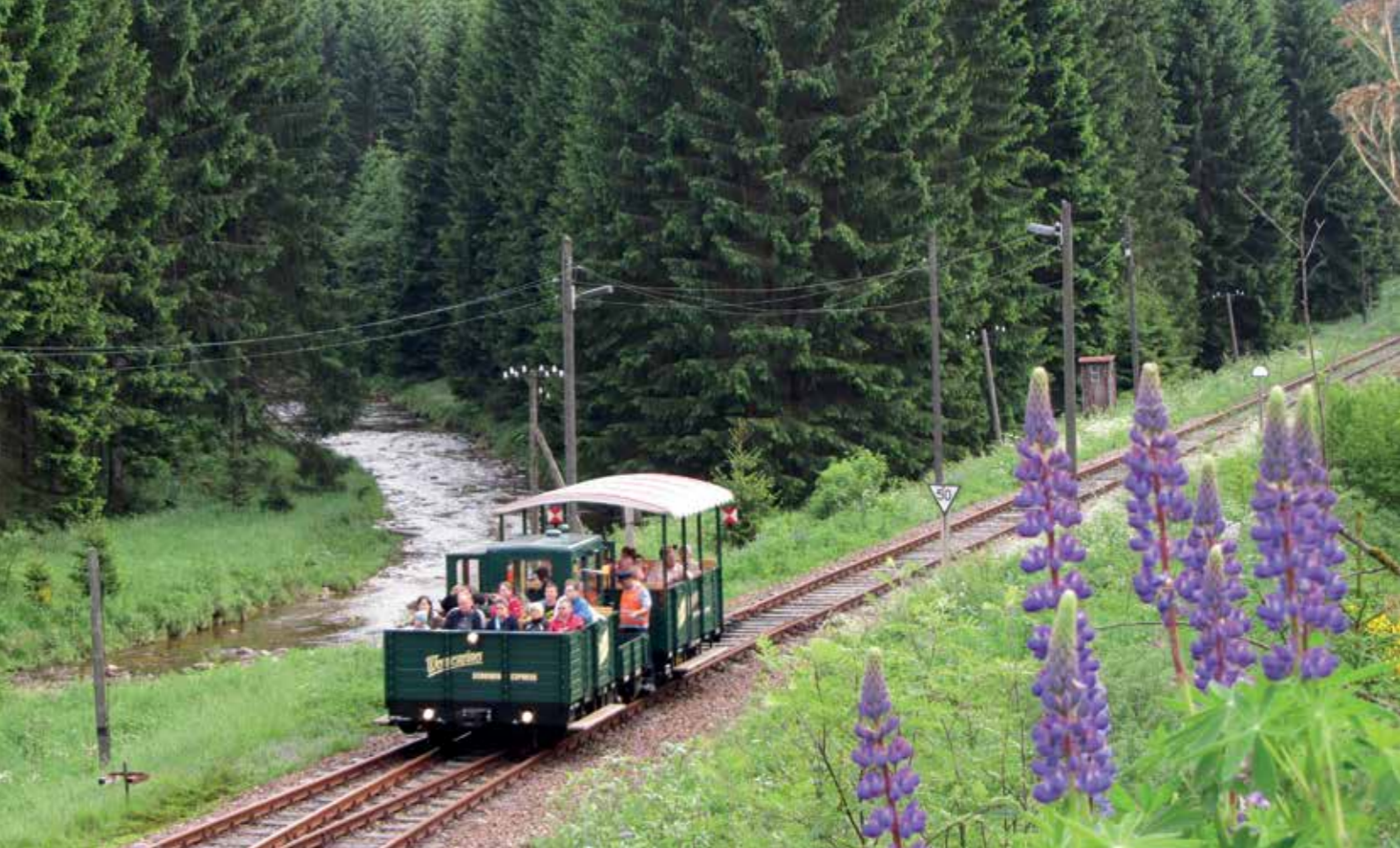
Im Tal der Zwickauer Mulde ist derzeit zwischen Hammerbrücke und Wilzschhaus der Wernesgrüner Schienenexpress unterwegs. Künftig ist eine Anbindung der Strecke an das Vogtlandnetz im Bahnhof Muldenberg beabsichtigt, womit erweiterte Möglichkeiten des Zugverkehrs verbunden sind.