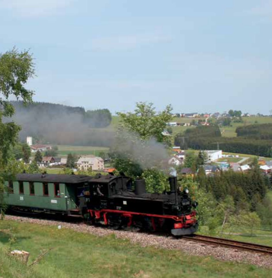
Inmitten der idyllischen Landschaft des Westerzgebirges ist ein Dampfzug der Museumsbahn Schönheide unterwegs.