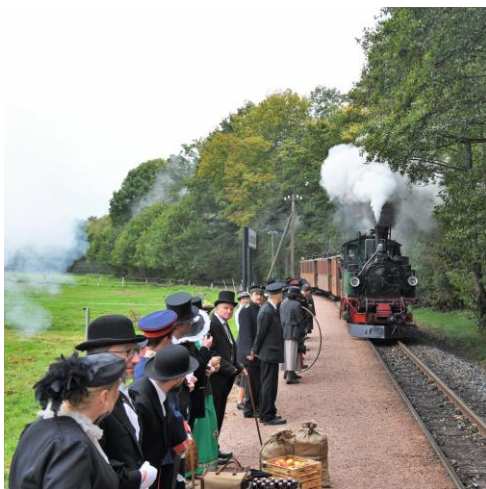
Szenen am Rande der Dreharbeiten für den Film „Zeitreisen unter Dampf“

Der neue Film des Dresdner Regisseurs Sebastian Linda unternimmt eine filmische Zeitreise entlang der sächsischen Schmalspurbahnen durch drei noch heute anhand in Sachsen erhaltener Fahrzeuge erlebbare Zeitepochen. Im Film beginnt die Reise um 1900 mit dem historischen I K-Zug bei der Preßnitztalbahn und mit dem Radebeuler Traditionszug. Der um 1900 vierjährige Hauptdarsteller taucht in der zweiten Epoche um 1930 als Eisenbahner rund um den historischen Reichsbahnzug bei der Zittauer Schmalspurbahn erneut auf. In den 1960er Jahren zum Lokführer befördert, ist er mit den bei der Döllnitzbahn und Lößnitzgrundbahn erhaltenen Zügen im Stil dieser Zeit unterwegs. Angekommen in der Gegenwart gibt der nun im Greisenalter befindliche Hauptdarsteller die Begeisterung für die noch immer täglich zu erlebenden Dampfzüge an die nächsten Generationen weiter. Wir danken den zahlreichen mitwirkenden Partnern und Darstellern für ihren Einsatz an diesem Gemeinschaftsprojekt. Mit rund 140.000 Aufrufen innerhalb von zwei Wochen auf Facebook und zusätzliche Aufrufe auf weiteren Plattformen ist der Film sehr gut angelaufen. In den nächsten Tagen wird zudem ein weiterer separat produzierter Film der Zittauer Schmalspurbahn erscheinen, der unter dem Titel „Ein Hauch der Goldenen Zwanziger“ näher in diese Epoche eintaucht.