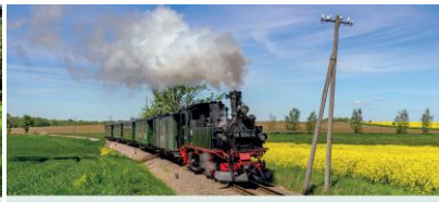
SAXON STEAM RAILWAY ROUTE