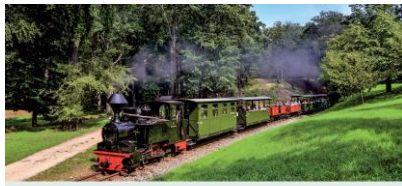
SAKSOŃSKI SZLAK PAROWOZÓW