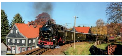
CESTA PO PARNÍCH ŽELEZNICÍCH V SASKU